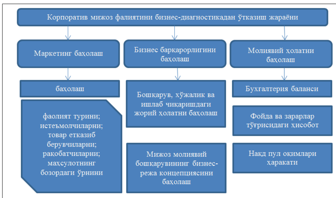
1-расм. Корпоратив миқоз фаолиятини бизнес-диагностикаси [3]

Миқозни маркетинг баҳолашнинг мақсади маҳсулотларга бўлган талаб ва уларни сотишни таҳлил қилиш, нарх сиёсатини аниқлаш, бозорнинг ушбу сегментида фаолият юритувчи бошқа компаниялар билан таққослаганда кучли ва заиф томонларини аниқлашдир.