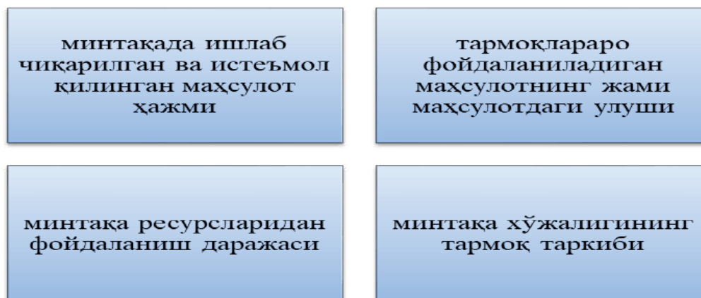
1-расм. Минтақа иқтисодий мажмуаси таркиби

мажмуасини такомиллаштириш билан боғлиқ. Бу ҳолатда минтақа иқтисодий мажмуасининг таркиби қуйидаги унсурлардан иборат бўлади: