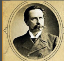
Карл Бенц 1885 год Германия