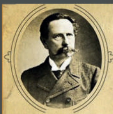
Карл Бенц 1885 год Германия