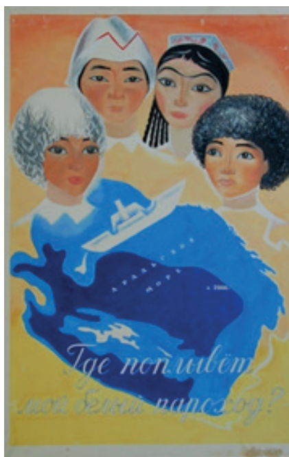
Плакат из серии «Вокруг Арала» «Где поплывет мой белый пароход».

О первопричинах создания плакатов автор рассказывала: “это не был заказ. Это была, скорее всего, атмосфера в общественном сознании” [3].