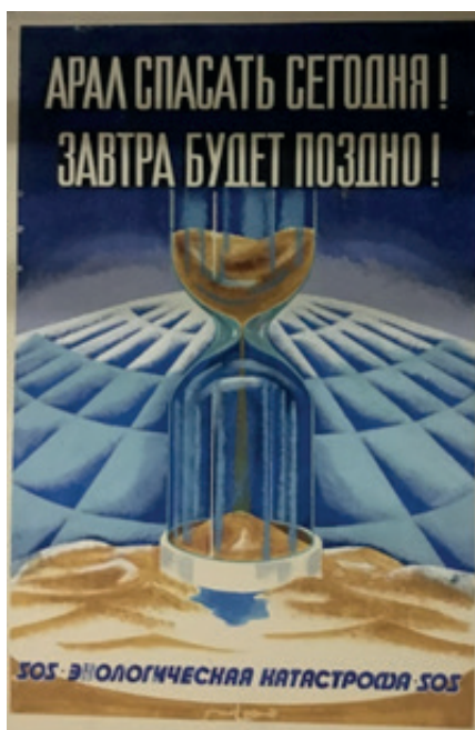
Плакат из серии «Вокруг Арала» «Арал спасать сегодня! Завтра будет поздно»

На плакате «Сакла - Береги» изображена композиция, призывающая к водосбережению. Руки олицетворяют «рукотворность» проблемы, что люди должны беречь воду как источник жизни, не доводя до обессточивания и опустынивания. Колористика и тон плаката решены в соответствии с названием работы, что также доказывает трагичность состояния Арала.