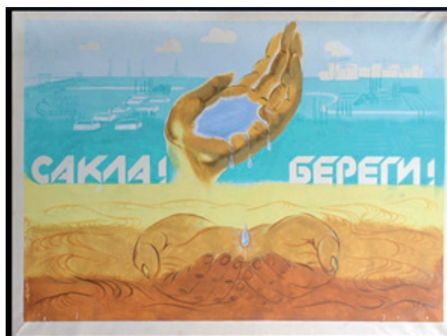
Плакат из серии «Вокруг Арала» «Береги»

И таким образом в 1990 году О.Жолдасова отправила на конкурс в Москву авторскую копию плаката «Промокнули».