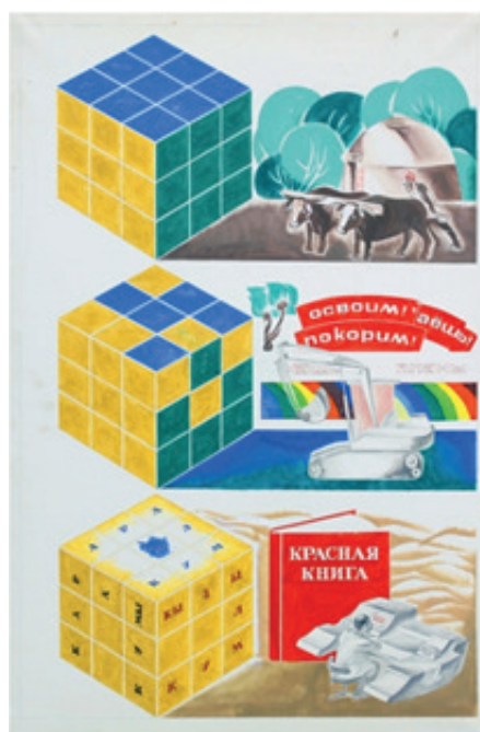
Плакат из серии «Вокруг Арала» «Головоломка»

В композиции «Арал спасать сегодня! Завтра будет поздно!» художник изобразил явный крик отчаяния, обращенный к миру, многократно призывающий о помощи SOS – в целую строку, в котором прочитывается «У нас катастрофа! Обратите внимание! Не оставайтесь равнодушными!». Изображенные посреди пустыни песочные часы символизируют об окончании времени, а темный синие холодные оттенки придают работе безысходность сложившейся ситуации.