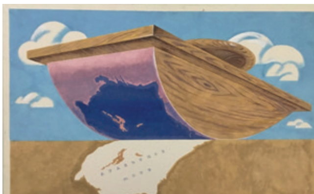
Плакат из серии «Вокруг Арала» «Промокнули».

На плакате «Промокнули» художником изображен большой пресс-бювар канцелярская принадлежность, прибор для промокательной бумаги. В этом образе художник использовала свои ассоциации пресс-бювара с промокательной бумагой, отображая бюрократический подход к решению вопросов экологии, водопользования и земледелия. На рисунке огромный пресс-бювар на фоне облачного неба промокнув Аральское море, высушил море, оставив отпечаток на колодке.