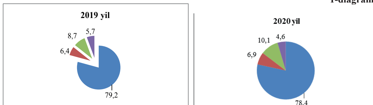
1-diagramma. Aloqa va axborotlashtirish xizmatlarining tarkibi