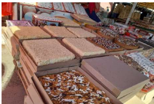
1-rasm. Namangan "Chorsu" savdo majmuasi

Ushbu savdo majmuasi sotuvchilari bilan suhbat olib borilganda, sotuvchilar: "biz ko'nikib qolganmiz, bu holatga o'zgartirish shart emas, rastalarni o'z hisobimizga qurishimiz kerak bizda yetarli mablag' yo'q, o'zimiz ham gigiyenaga to'g'ri kelmasligini bilamiz" kabi fikrlarni bildirishdi.