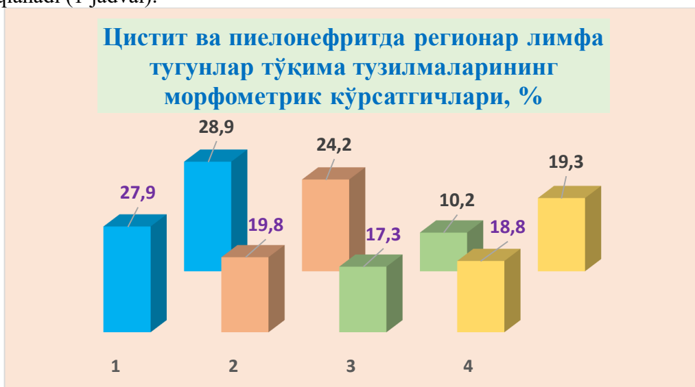
1-grafik. 1-limfoid follikulalar, 2-parakortikal maydon, 3-sinusoidlar bo‘shlig‘i, 4-yumshoq tasmalar. Oldingi qator – nazorat guruhi. Orqa qator – tsistit va pielonefrit.

Natijalar. Sistit va pielonefrit kasalliklarida regionar limfa tugunlar to‘qima tuzilmalari morfomerik usulda tekshirilganda ma‘lum bo‘ldiki, limfa tugunning po‘stloq qavati, jumladan limfoid fillikulalar giperplaziyalanib, maydonini kengaytirganligi, nazotar guruhida 27,93% tashkil qilgan bo‘lsa, infeksiyon pielonefritga javoban limfa tugunlar po‘stloq qavati limfoid follikulalar egallagan maydon 35,7% tashkil qilib, nazorat guruhiga nisbatan 8,3% keng joyni egallaganligi aniqlandi. Organizmning xujayraviy immunitetini amalga oshiradigan limfa tugunlar parakortikal maydoni nazoratguruhida o‘rtacha 19,82% tashkil qilgan bo‘lsa tsistit va pielonefrit kasalliklarida biroz qisqarib, 16,4% joyni egallaganligi kuzatildi. Bu esa organizmda hujayraviy immunitet biroz pasayganligini ko‘rsatadi. Sisti va pielonefrit ko‘pincha bakteriyalar tomonidan qo‘zg‘atilganligi sababli organizmda gumoral immunitet kuchayganligi bilan davom etadi. Natijada gumoral immunitetga javobgar limfa tugunlar po‘stloq qavat limfoid follikulalarning giperplaziyalanishi bilan bir qatorda mag‘iz qavat sineusoidlarining yumshoq tasmalari V-limfotsitlarga to‘lib-toshib, maydoni kengayganligi (23,6%) kuzatiladi, buning natijasida sinusoidlar bo‘shlig‘i siqilib, torayganligi (10,05%) aniqlanadi (1-jadval).