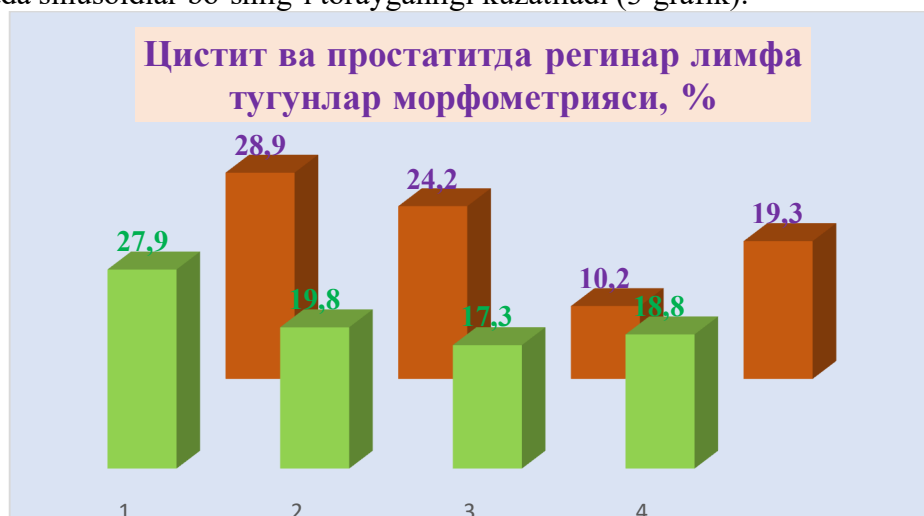
3-grafik. 1-limfoid follikulalar, 2-parakortikal maydon, 3-sinusoidlar bo‘shlig‘i, 4-yumshoq tasmalar. Oldingi qator – nazorat guruhi. Orqa qator – tsistit va pielonefrit.

Surunkali uretrit va prostatit kasalliklari ko‘pincha ureplazma, xlamidiy tomonidan qo‘zg‘atilganligi sababli organizmda gumoral immunitetdan hujayraviy immunitet ustun turganligi kuzatiladi. Ushbu kasalliklarda immun tizimning periferik a‘zolari bo‘lgan limfa tugunlarda rivojlangan morfologik va morfometrik o‘zgarishlar aynan hujayraviy immunitetning faollashganligini tasdiqlaydi. Morfometrik jihatdan limfa tugun to‘qimasida parakortikal maydon nazorat guruhiga nisbatan sezilarli daraja kengayganligi (26,2%), po‘stloq qavat limfoid follikulalar maydoni nazorat guruhiga nisbatan kamayganligi aniqlandi (2-jadval). Limfa tugun mag‘iz qavati tomonidan yumshoq tasmalarning kengligi oldingi guruhga o‘xshash saqlanib qolganligi, natijada sinusoidlar bo‘shlig‘i torayganligi kuzatiladi (3-grafik).